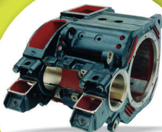
Estator Motor Tração GE Mod. 761