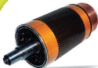
Armatura Motor Tração GM Mod. D77