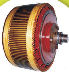
Armatura Gerador GE Mod. 581/586