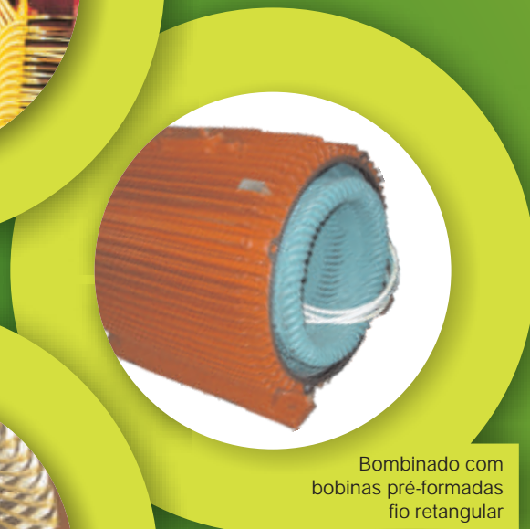
Bombinado com bobinas pré-formadas fio retangular