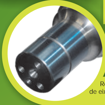
Recuperação de eixos, tampas e mancais