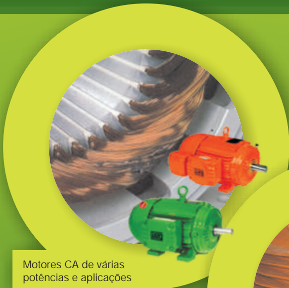
Motores CA de várias potências e aplicações

Fabricamos bobinas de estatores para todos os tipos de motores nas tensões de até 6,6 kV com mão-de-obra especializada e curto prazo de entrega.