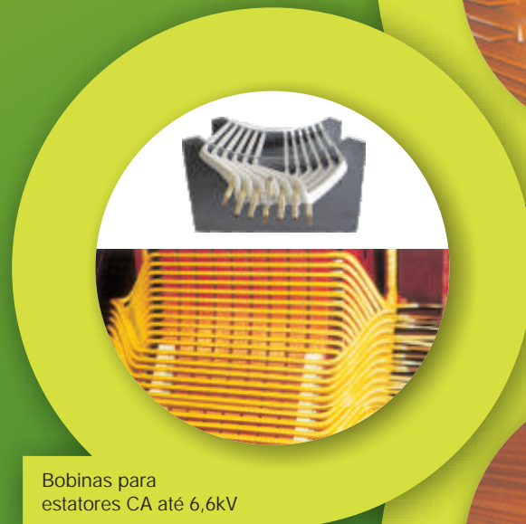
Bobinas para estatores CA até 6,6kV