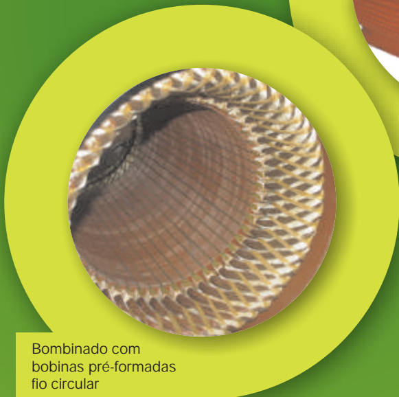
Bombinado com bobinas pré-formadas fio circular